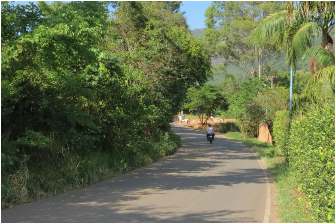
Entrada Zé Ameriquinho 01

Rua São Geraldo, 30 - térreo - CEP 12955-000 - Fone: 4012-7535 - Bom Jesus dos Perdões - SP