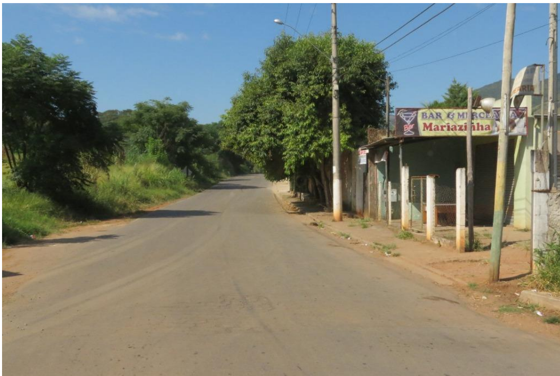
Campo do América sentido bairro