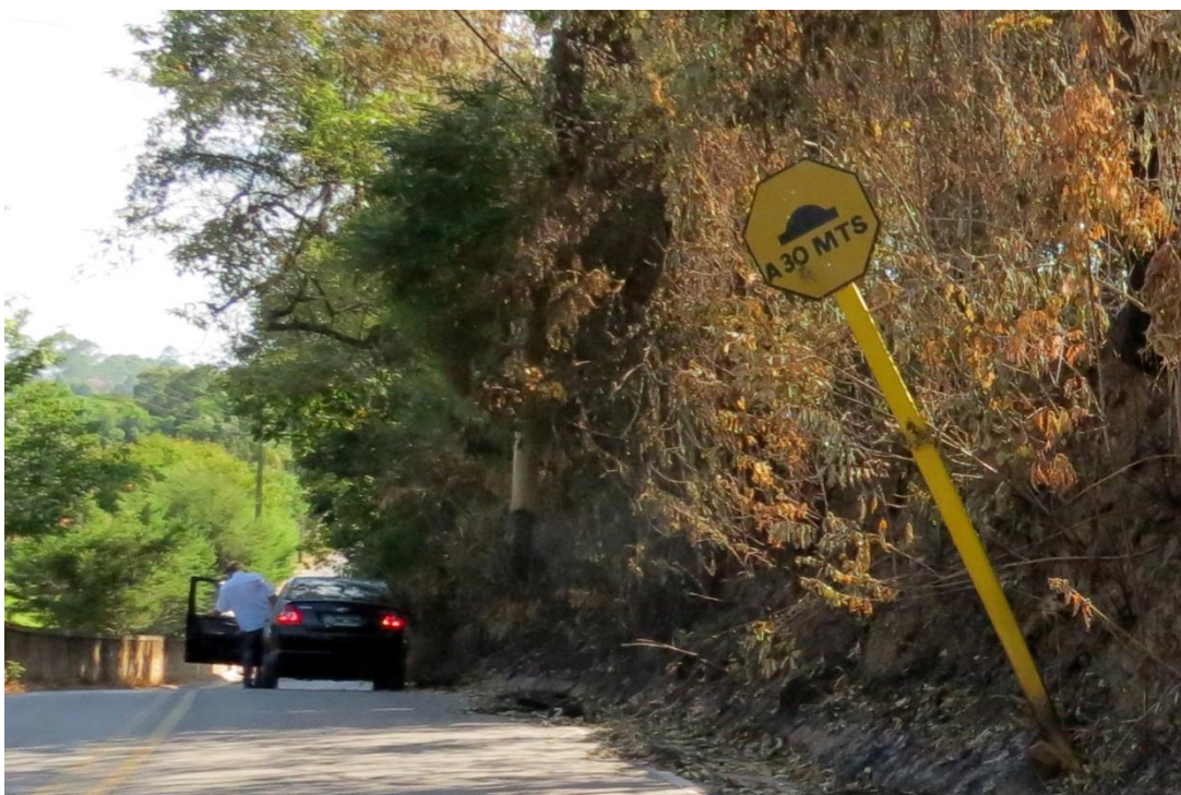
Início da subida da Cachoeira - foto sentido cidade 02