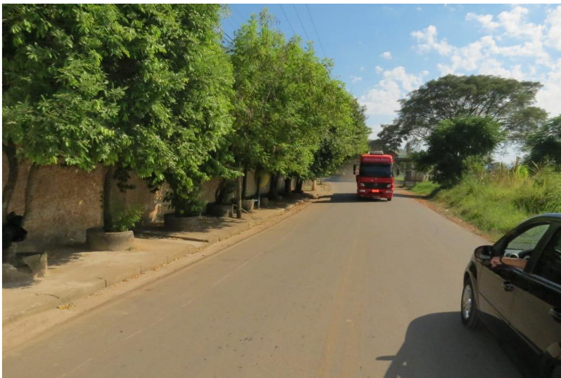
Campo do América sentido cidade