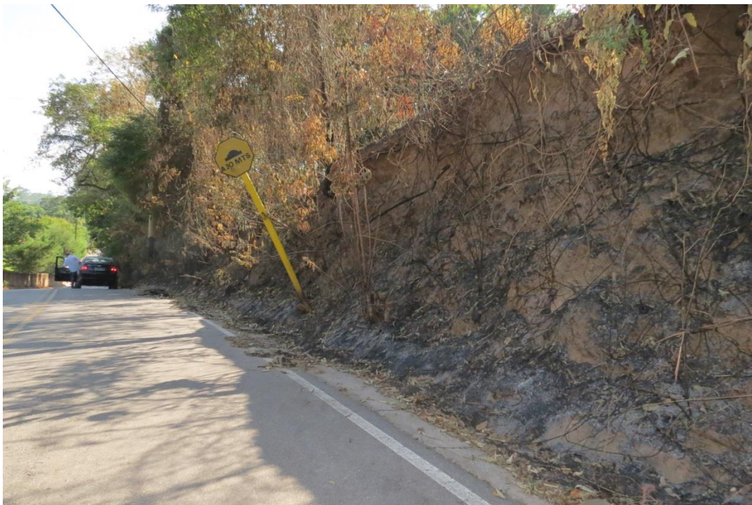
Início da subida da Cachoeira - foto sentido cidade 01

Rua São Geraldo, 30 - térreo - CEP 12955-000 - Fone: 4012-7535 - Bom Jesus dos Perdões - SP