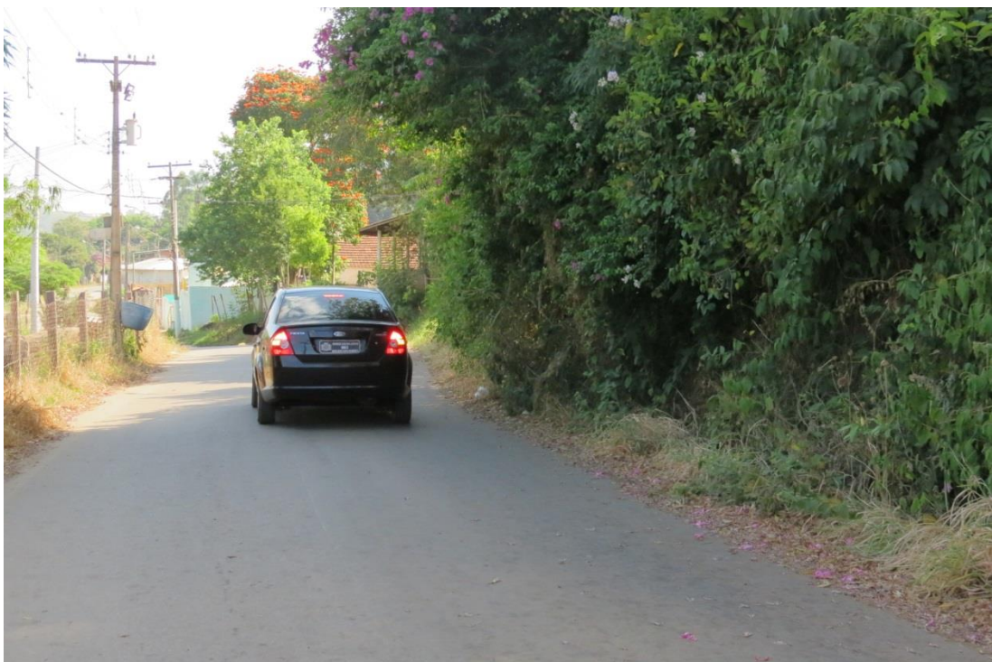
Altura da entrada do campo do Cruzeiro